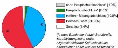
Ausbildungsbereich öffentlicher Dienst