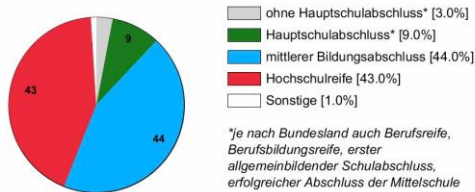
Ausbildungsbereich Industrie und Handel