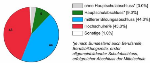
Ausbildungsanfänger/innen 2017 (in %)

Rechtlich ist keine bestimmte Schulbildung vorgeschrieben. In der Praxis stellen Betriebe und Verwaltungen überwiegend Auszubildende mit mittlerem Bildungsabschluss oder Hochschulreife ein