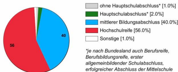
Ausbildungsbereich öffentlicher Dienst